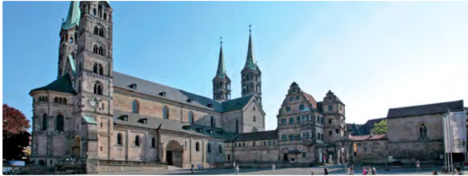
Bamberger Domplatz