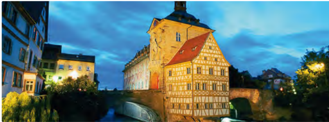
Bamberg bei Nacht