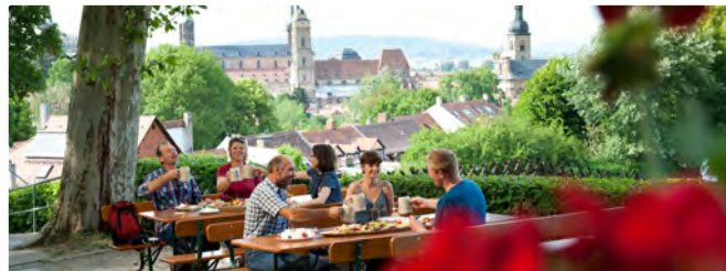
Prost im Biergarten (24.05.2011,)

„Bistumsstadt“ ist Bamberg bereits seit tausend Jahren, in der „Einkaufsstadt“ bummelt man durch moderne Geschäfte im historischen Ambiente. Jeden Winter verwandelt sich Bamberg in eine „Krippenstadt“ voller Zauber - verzaubert wird man zudem das ganze Jahr über in der prächtigen „Barockstadt“ Bamberg. International ist die „Kulturstadt“ Bamberg mit den weltberühmten Bamberger Symphonikern.