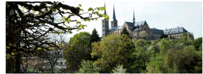
Blick auf St. Michael