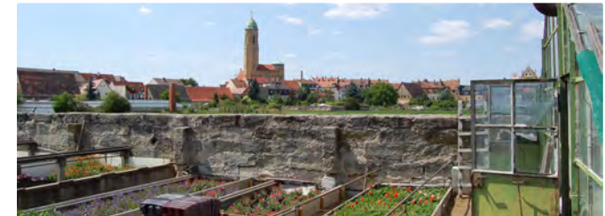
In der Gärtnerstadt

Karte am Ende des Dokuments in höherer Auflösung.