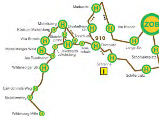
Linienerlauf Entdeckerlinie 910

Mehr Infos unter: http://www.stadtwerke-bamberg.de/de/Mobilitaet/Entdeckerlinie-910/Entdeckerlinie-910.html