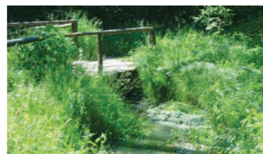
Brücklein über den Finsterbach

Gut markiert führt uns der 1 bei der folgenden Gabelung nach links und schließlich weiter bis vor die ICE-Trasse und die A 9 Nürnberg–München. Nur kurz an den Leitplanken entlang links abwärts, nutzen wir danach rechts am Finsterbach entlang die beiden Tunnel durch diese Verkehrsadern.