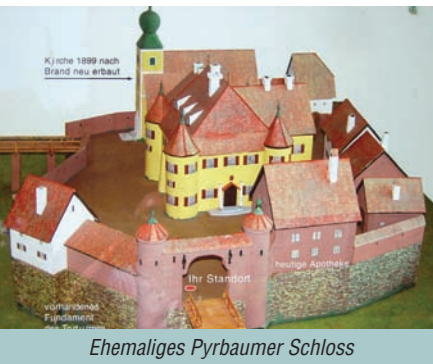
Ehemaliges Pyrbaumer Schloss

Gabelungen durch den abwechslungsreichen Waldbestand. Hinter einer Senke steigt der breite Weg dieses Mal etwas lang gezogen an. Kurz vor dem Waldaustritt verlassen wir erneut unser hier rechts