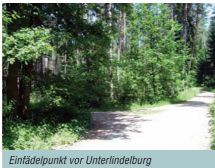
Einfädelpunkt vor Unterlindelburg

Um den Weg nach Lindelburg nicht zu verpassen, heißt es jetzt „ Augen auf “. Nach einer Vielzahl von Fichten am linken Wegesrand erkennen wir zwei nicht gerade wuchtige Eichen, von denen die rechte (von hinten betrachtet) dreigeteilt ist. Der gleich dahinter nach links führende Waldweg (siehe Foto) ist der richtige, was uns der wieder bestätigt.