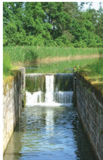
Kanalschleuse bei Pfeifferhütte

Auf dem Fuß- und Radweg Richtung Pfeifferhütte abwärts treffen wir später auf den alten Ludwig-Donau-Main-Kanal*. Auf dessen Treidelwegen wandern wir nach rechts (kanalwärts) über die B 8 und später die Ortsverbindungsstraße weiter über zwei Schleusen bis zum Bahndamm der Bahntrasse Nürnberg – Neumarkt i. d. OPf. Hier dann links zum Gleis Richtung Neumarkt, durch die Bahnunterführung zum Gleis Richtung Nürnberg.