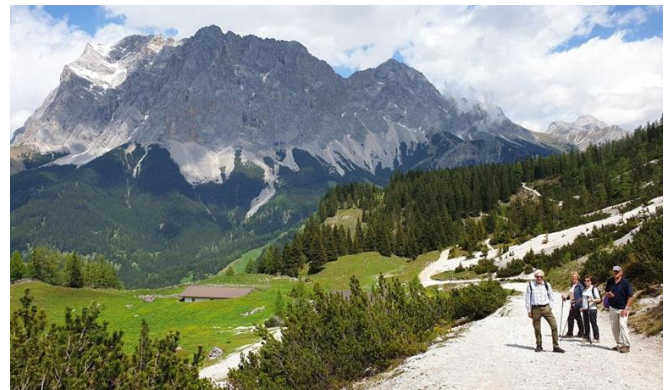
Schneefernerkopf und Zugspitze (links dahinter)

-> Leider war die Seeben Alm geschlossen. Entgegen den Auskünften und unverständlich bei den vielen Wanderern. An der Bergstation waren sogar 2 Wirtschaftsbetriebe geöffnet und gut besucht! Leider haben wir die kleinere, gemütlicher aussehende Alm zu spät entdeckt, aber Kaffee, Kuchen, Eis und Co. mundeten auch auf der großen Terrasse.