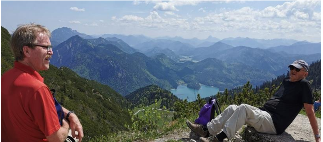
(Blick vom Herzogstand zum Walchensee)

Heute wollten wir zur Alspix am Osterfelder Kopf fahren, bzw. wandern : ging nicht -> s. S. 1. Also entschieden wir uns für den Herzogstand am Walchen-/ Kochelsee. Das war dann mehr als nur ein Ersatz. Die Wanderung (wir starteten an der Bergstation der Gondel) zu Gipfelkreuz und Pavillon (nicht alle) war ein Erlebnis. Die Strecke kann man auch mit Kindern gehen (nicht mit kleinen oder Kinderwagen). Wolfgang ist den leichteren Panorama-Naturlehrpfad gegangen.