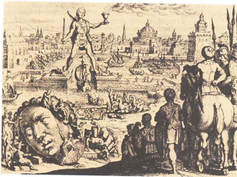
Der Koloss, eines der Sieben Weltwunder, über der Hafeneinfahrt von Rhodos.

Illustrationen von Peter Klauke und Frank Kliemt