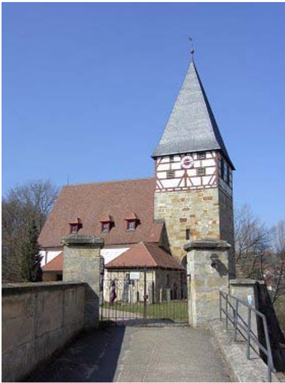
Wehrkirche St. Michael in Rasch