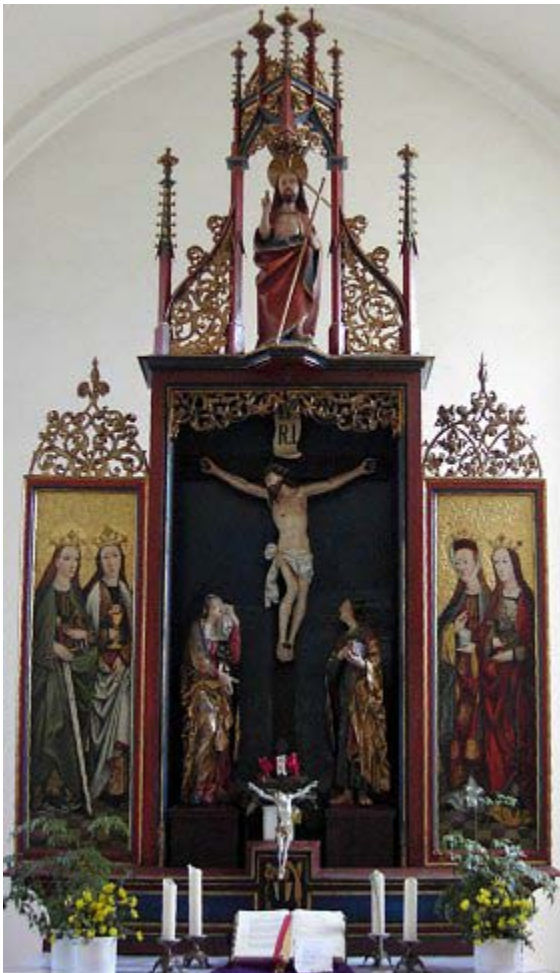
Altar in der Kirche St. Michael in Rasch

Auf dem Rückweg durch den Talgrund der Schwarzach liegt Rasch mit schönen Fachwerkhäusern, darunter besonders bemerkenswert das Pfarrhaus, einst Sitz Nürnberger Patrizier, und mit der evangelischen Pfarrkirche St. Michael aus dem 11./12. Jahrhundert, einst Mutterkirche eines Gebietes, das bis Kornburg im Westen und Mögeldorf und Leinburg im Norden reichte. Der hervorragende spätgotische Flügelaltar lohnt die Mühe, im nahen Pfarrhaus um den Schlüssel für die Kirche zu bitten: Die Gemälde der hl. Katharina, Barbara, Maria Magdalena und Margareta stammen aus einer Nürnberger Werkstatt; auf der Rückseite der Flügel befinden sich bemerkenswerte Darstellungen des Tempelgangs und der Verkündigung Mariens, der Anbetung der Könige und des Pfingstwunders.