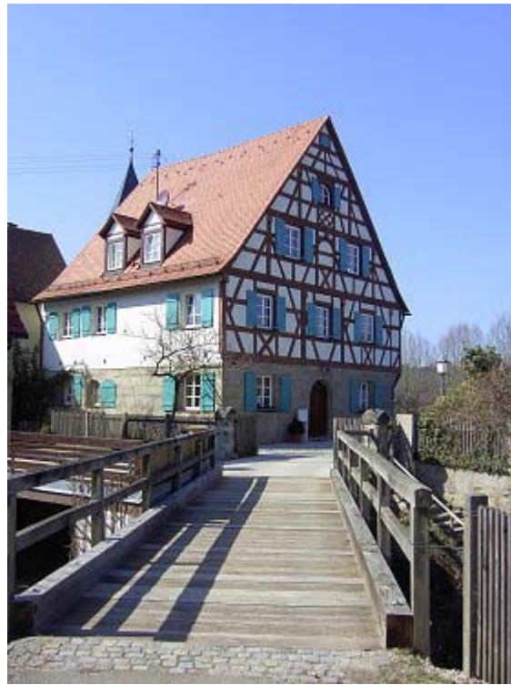
Pfarrhof in Rasch